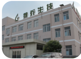
锦乔生物科技 安徽宿州一厂