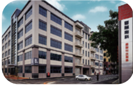
丰华生物科技 台湾台南厂