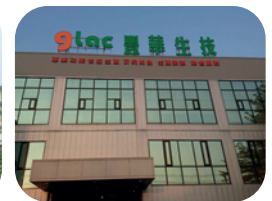
丰华生物科技 台湾嘉义厂