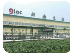
锦乔生物科技 江苏淮安厂