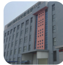
锦麒生物科技 安徽宿州二厂