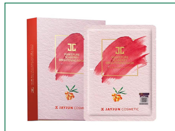
沙棘水润焕亮面膜