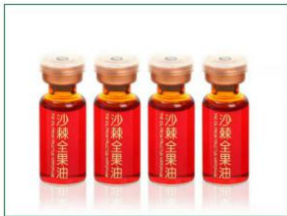
沙棘全果油口服液