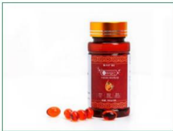
沙棘全果油凝胶糖果