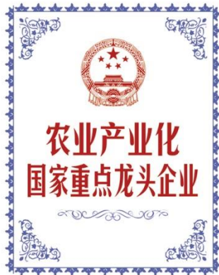
农业产业化国家重点龙头企业 National Key Leading Enterprise in Agricultural Industrialization