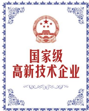
国家级高新技术企业 National High-Tech Enterprise