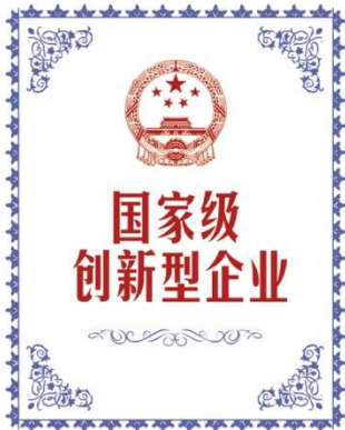
国家级创新型企业 National Innovative Enterprise