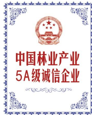
中国林业产业5A级诚信企业 National Forestry Industry Grade 5A Honest Enterprises