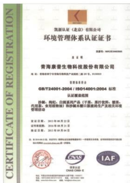
ISO14001: 2004环境管理体系认证 ISO14001: 2004 NvIRONMENTAL Management System Certification