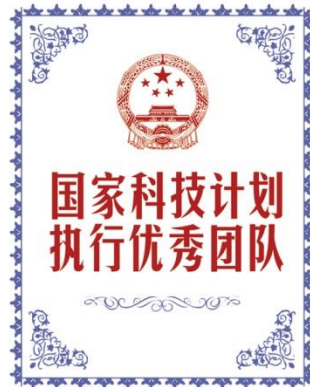
国家科技计划执行优秀团队 Excellent Unit for Carrying Out National Scientific & Technological Program