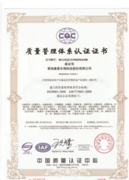
ISO9001: 2008质量管理体系认证 ISO9001: 2008 Quality Management System Certification

美国FDA进出口注册 American FDA(Food and Drug Administration) Registration