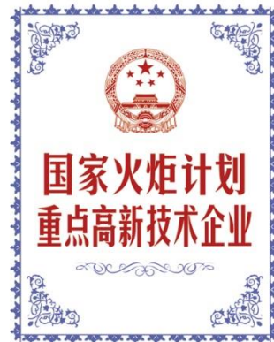
国家火炬计划重点高新技术企业 National Key High-Tech Enterprise for Torch Program