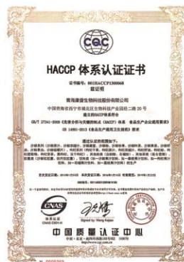
HACCP 食品安全保证体系认证 HACCP System Authentication