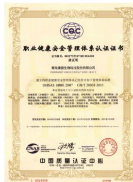
职业健康安全管理体系认证 Occupational health and safety management system Certification