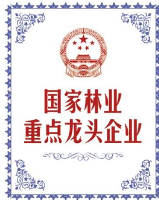
国家林业重点龙头企业 National Key Leading Enterprise of Forestry