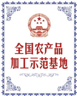
全国农产品加工示范基地 National Demonstration Base for Agricultural Product Processing