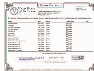
国际KOSHER 犹太洁食认证 Kosher Jewish Certification of Clean Food