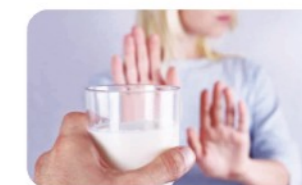
乳糖不耐受者适用