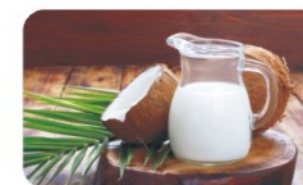
优于动物脂肪来源