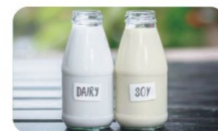
与全脂奶粉一致的蛋白及脂肪含量