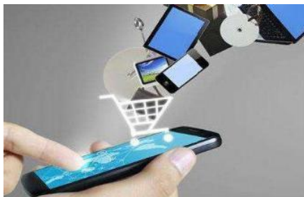
◆ 电商 微商