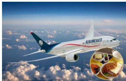
◆ 特渠 (航空、高铁)