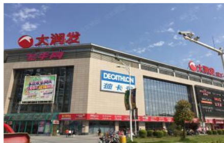
◆ 通路 (商超、便利店、门店)