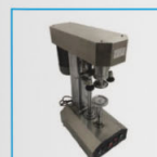
实验室铁罐封口机