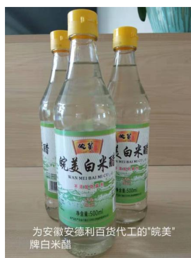
为安徽安德利百货代工的“皖美”牌白米醋