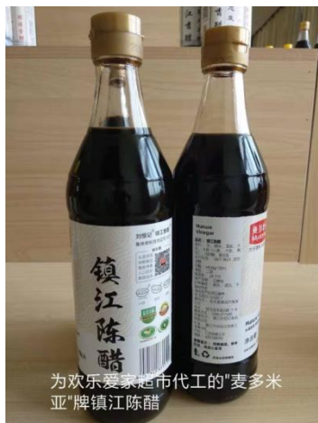
为欢乐爱家超市代工的“麦多米亚”牌镇江陈醋