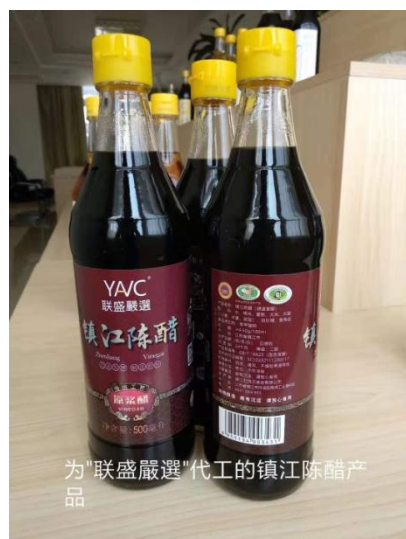
为“联盛严选”代工的镇江陈醋产品