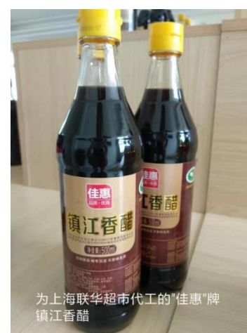
为上海联华超市代工的“佳惠”牌镇江香醋