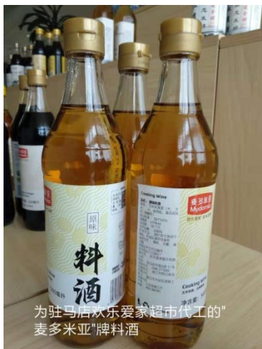
为驻马店欢乐爱家超市代工的“麦多米亚”牌料酒