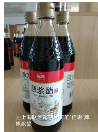
为上海联华超市代工的“佳惠”牌原浆醋