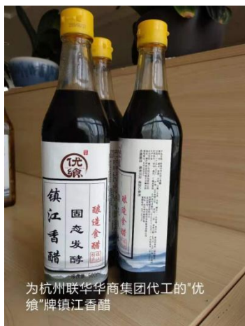
为杭州联华华商集团代工的“优鲜”牌镇江香醋