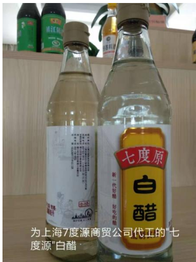
为上海7度源商贸公司代工的“七度源”白醋