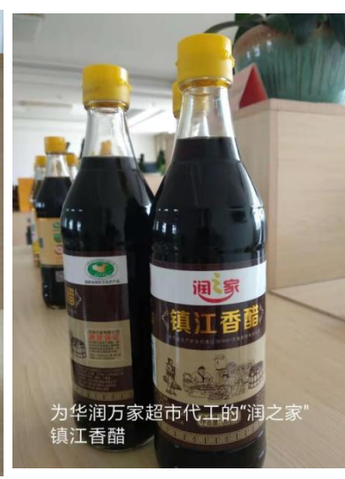
为华润万家超市代工的“润之家”镇江香醋