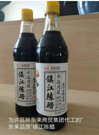
为许昌胖东来商贸集团代工的“东来品质”镇江陈醋