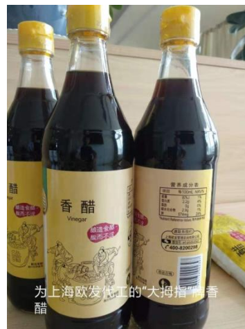
为上海欧发代工的“大拇指”牌香醋