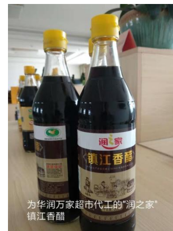
为华润万家超市代工的“润之家”牌镇江香醋