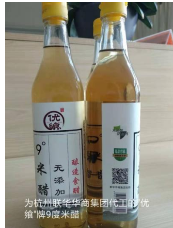
为杭州联华华商集团代工的“优鲜”牌9度米醋