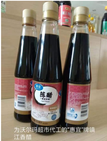
为沃尔玛超市代工的“惠宜”牌镇江香醋