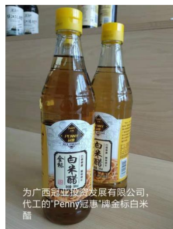
为广西冠业投资发展有限公司代工的“Penny冠惠”牌金标白米醋