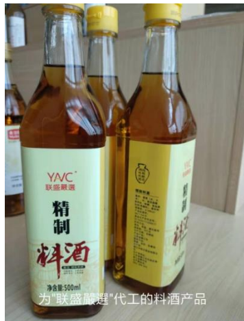
为“联盛旗牌”代工的料酒产品