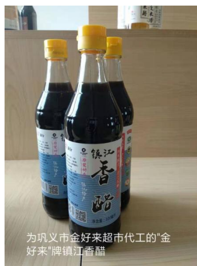
为巩义市金好来超市代工的“金好来”牌镇江香醋