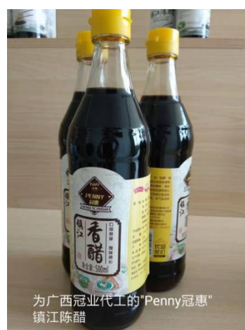
为广西冠业代工的“Penny冠惠”牌镇江陈醋