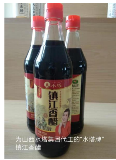
为山西水塔集团代工的“水塔牌”镇江香醋