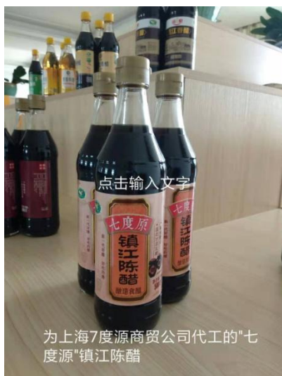
为上海7度源商贸公司代工的“七度源”镇江陈醋