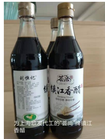
为上海欧发代工的“荟尚”牌镇江香醋