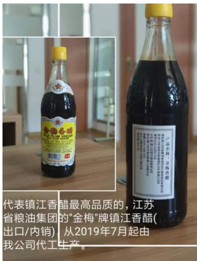
代表镇江香醋最高品质的，江苏省粮油集团的“金梅”牌镇江香醋(出口/内销) 从2019年7月起由我公司代工生产。