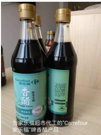
为家乐福超市代工的“Carrefour 家乐福”牌香醋产品