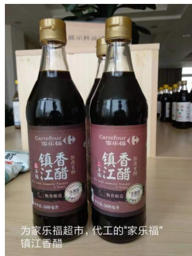
为家乐福超市，代工的“家乐福”镇江香醋