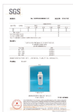
多次皮肤刺激试验