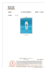
急性眼刺激性测试