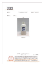
急性经口毒性测试